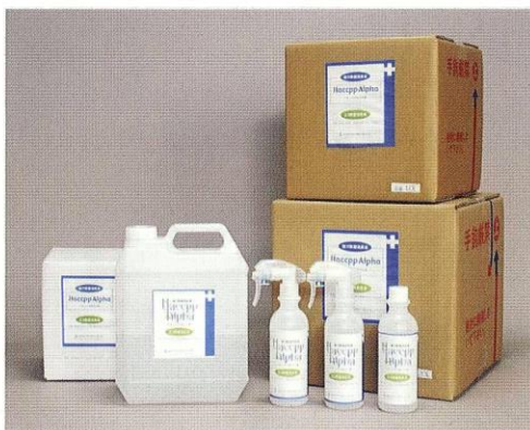
「ハセッパールファ水」荷姿