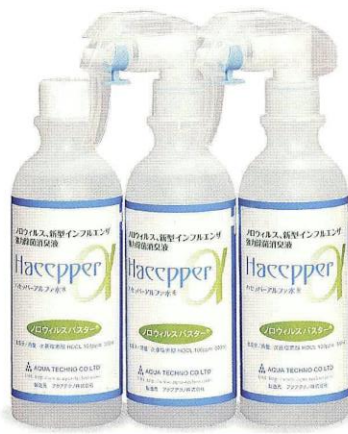
「ハセッパールファ水」スプレー 100ppm 300ml入

強力な次亜塩素酸の酸化力で瞬時に無臭化。 室内トイレ、汚物あと処理、ペット室内まで、用途が広がります。